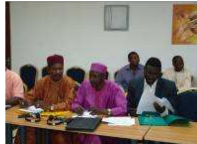
des trois pays.....

l'ensemble de la sous région. » Notre objectif, a-t-elle poursuivi, « étant la préservation d'un climat de sécurité propice à la réalisation des Objectifs du Millénaire