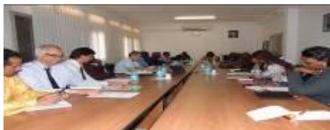
Séance de travail avec l'Equipe Pays du SNU

A ce niveau, il a été question d'examiner les voies et moyens pour redynamiser la coopération avec le FIDA. En effet, l'Institution est présente au Niger depuis 1980, et a financé huit projets et programmes au Niger pour un total de financement mobilisé de 235,6 millions de dollars. Trois projets sont actuellement en cours d'exécution. Le Directeur de la Division Afrique de l'Ouest et du Centre a réitéré la volonté et l'engagement de son Institution à poursuivre sa coopération avec le Niger aussi bien dans le cadre de son programme de coopération en cours, que dans la résolution structurelle des crises alimentaires récurrentes au Niger.