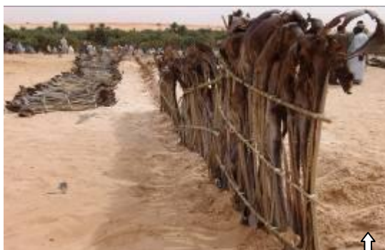
Opération de fixation mécanique de dune sur le site du lancement du PLECO (département de Maïné-Soroa)