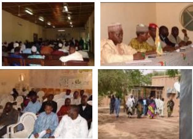
Quelques moments forts de la cérémonie de lancement du PADEL et de la réunion du Comité de pilotage du projet.

A cet effet, il mettra les collectivités locales au centre d'actions diverses qui contribueront à une meilleure intégration de la sécurité alimentaire dans les stratégies de développement local tout en améliorant l'offre de services financiers au niveau local et en contribuant au développement du secteur de la Microfinance ainsi qu'à la coordination et le pilotage de la mise en œuvre de la décentralisation (développement institutionnel et renforcement organisationnel) aux niveaux central, régional et local.