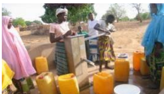
Forage réhabilité au village de Moli Campement touristique à