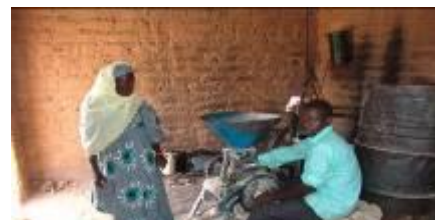
Photo illustrative : Acquis du PADEL/Mayahi : moulin à grains (commune de Serkin Haoussa)

enregistrés dans le cadre du programme de coopération qui lie les deux parties. Il a par ailleurs invité les différents acteurs, notamment les populations bénéficiaires à s'approprier , ce projet de grande importance.