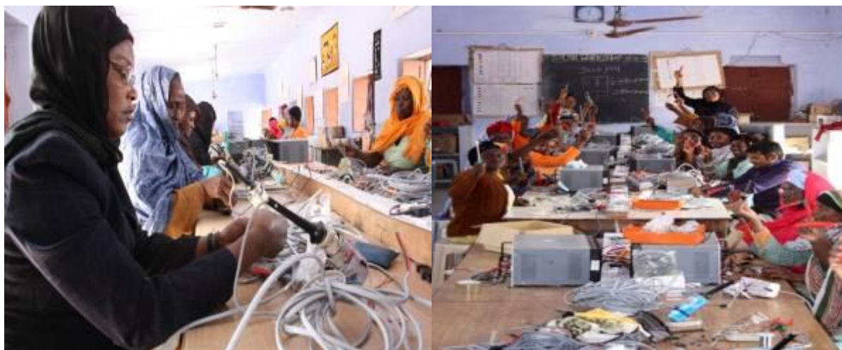
Les femmes de Moli et Baniguetti en formation au Barefoot college à Tilonia en Inde (Fev.10). Ces femmes reviendront au Niger pour faire les installations, l'extension, la maintenance et la gestion de la boutique des pièces détachées des matériels solaires