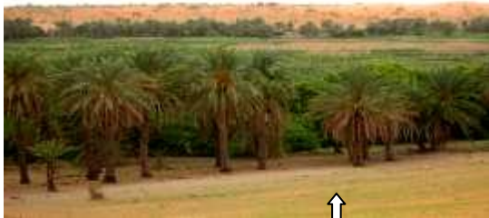
Oasis menacée par les dunes de sable

D'un budget de 2.020.000 US$, financé par le Fonds pour l'Environnement Mondial (FEM) et complété par un co-financement de 13.280.000 US$ de plusieurs sources gouvernementales, municipales, des projets et des donateurs, le projet sera mis en œuvre sur une période de cinq (5) ans.