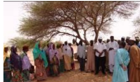
Entretien avec les populations de Dadin Sarki (Zinder : site d'Aménagement des terroirs pastoraux )

En marge du lancement, les participants ont effectué des visites sur les sites de deux projets mis en œuvre dans les régions de Diffa et de Zinder, avec l'appui du PNUD/FEM: Il s'agit du projet « Mise en place des gomméraires par fixation de dunes » et le projet « Aménagement des terroirs pastoraux .» -----&-----