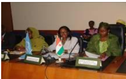
La ministre de la P/PF/PE avec à sa droite Madame le Coordonnateur résident du SNU au Niger