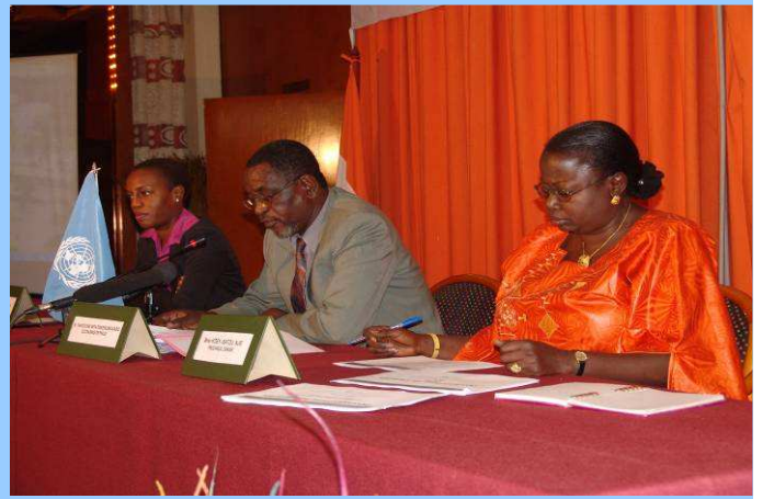
A l'extrême gauche, la Représentante. R. Adjointe aux Programmes, au milieu, l'Economiste Principal du PNUD et à l'extrême droite, la Conseillère régionale en DC, PNUD -WCA