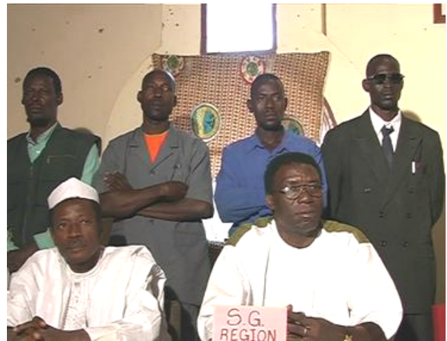
Vue partielle des membres du bureau de la CREA (Commission Régionale de l'Eau et de l'Assainissement)

Cette dernière, qui occupe l'extrémité occidentale de la Région de Tillabéry sur 39 843 km 2 , compte 1.783.781 habitants