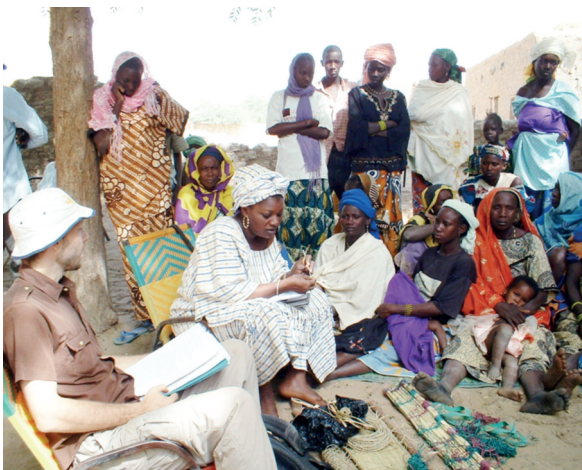
Transformation de la jacinthe d'eau en produits de l'artisanat sur l'île Seno, Tillabéry. Financement du PMF/FEM/PNUD à travers la société civile (ONG Ecole Instrument de Paix).