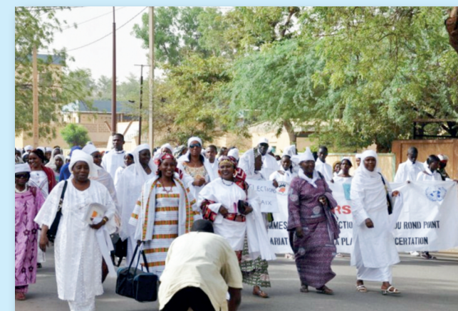
Elections apaisées à travers les ONG féminines financées par le PNUD

Les Organisations de la société civile (OSC) sont les canaux d'expression majeurs de l'opinion et des aspirations publiques. Le PNUD Niger espère ainsi renforcer les capacités des OSC à mener l'analyse et la formulation de positionnements stratégiques, la négociation et le plaidoyer, afin de favoriser l'implication des citoyens dans la prise de décision.