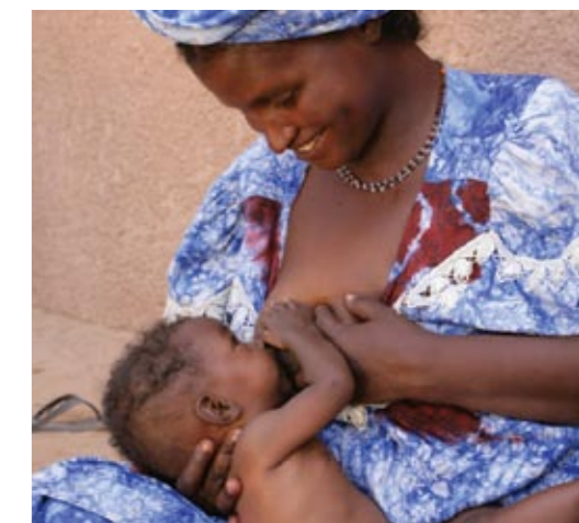
L'espacement des naissances permet d'allaiter aussi longtemps que l'on veut.

Les méthodes de contraception sont variées. Choisir un contraceptif adapté se discute avec le médecin ou la sage femme. Plusieurs facteurs sont pris en