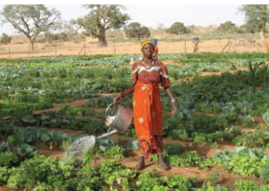
Bénéficiaires sur le site maraîcher de Tessa – Dosso

Dans de nombreux pays, les femmes sont les principales productrices de produits alimentaires. Elles jouent aussi un rôle capital pour la collecte du bois et de l'eau. Elles ont un rôle crucial dans le bien-être des populations rurales. Leur confinement aux tâches ménagères les empêche souvent de s'engager dans des emplois rémunérés. Ainsi, en dépit du rôle considérable qu'elles jouent dans la