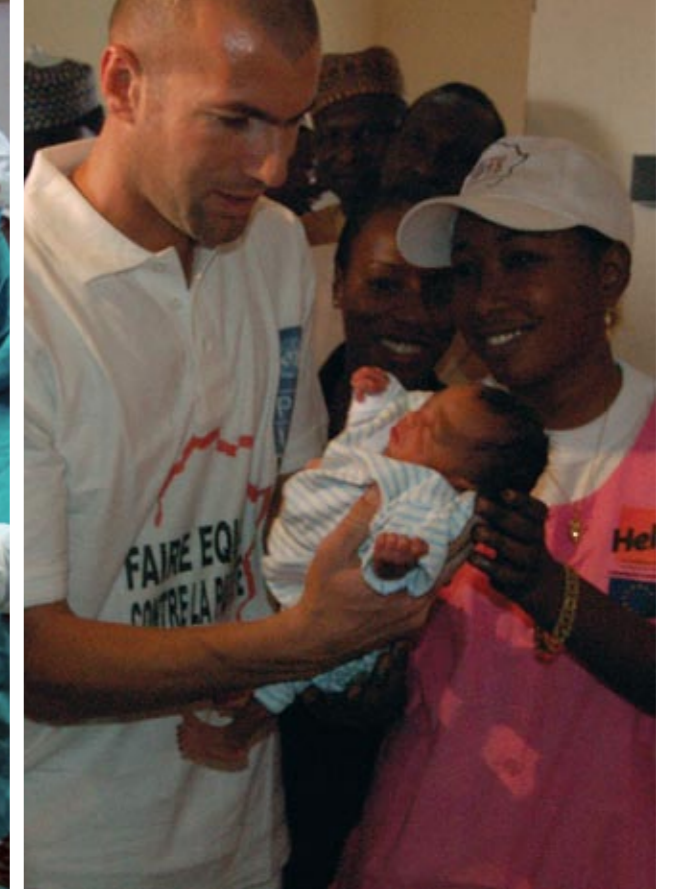
Zinéidine Zidane, ambassadeur itinérant du PNUD en visite à la maternité de Maina.