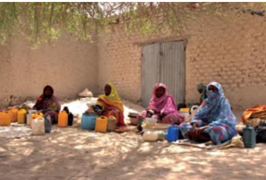
Empowering des femmes dans la coopérative d'Iwacu - Rwanda

L'UNIFEM est le Fonds de Développement des Nations Unies pour la Femme. Depuis sa création en 1977, il appuie techniquement et financièrement les initiatives novatrices visant à promouvoir l'émancipation de la femme et à assurer l'égalité entre les sexes. Actuellement, il œuvre pour améliorer la vie des femmes et des petites filles dans plus de 100 pays. Il aide également les femmes à se faire entendre au sein de l'organisation des Nations Unies – en soulevant des questions critiques et en militant pour la concrétisation des engagements pris en faveur des femmes.