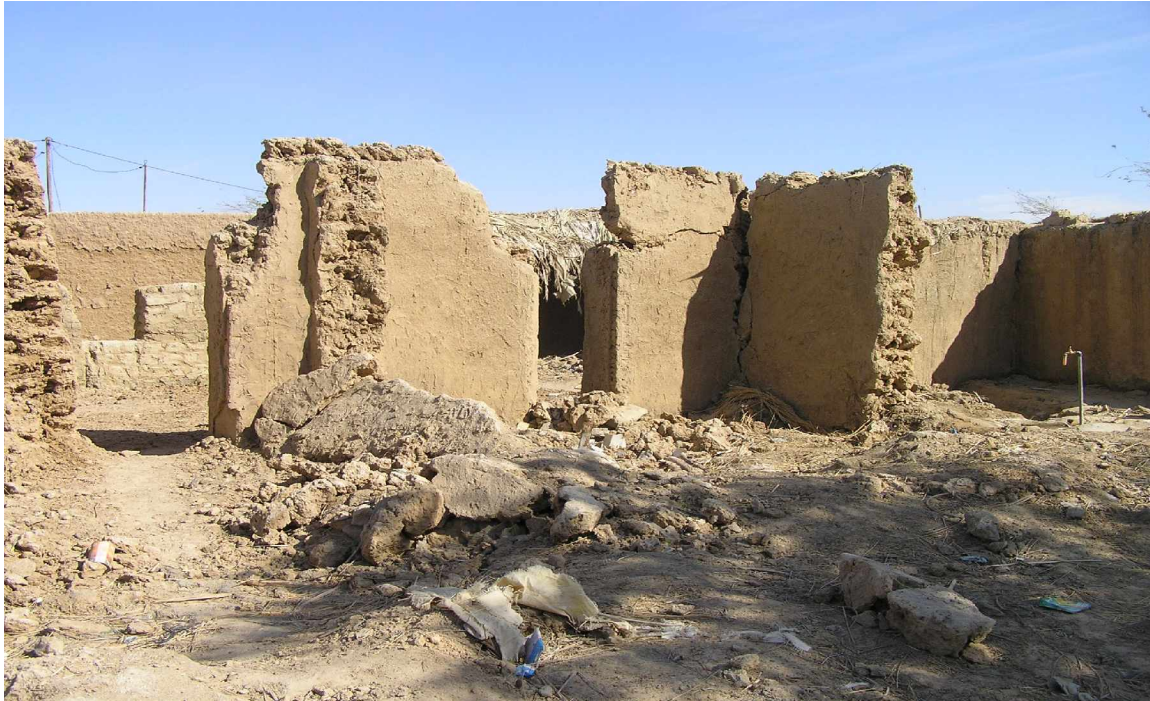
Effondrement de maison

Un comité de gestion et de reconstruction a été créé suite aux inondations par un arrêté préfectoral et est présidé par le préfet. Le comité est composé de chefs de quartiers, conseillers municipaux, un ancien député national, des experts des services techniques, la gendarmerie et des personnes ressources. Le comité est formé à base d'élus et de représentants des communautés par souci de transparence et de représentativité. Les décisions sont toutes prises en comité. De plus, des réunions sont aussi tenues régulièrement avec les autres associations et ONGs pour assurer des efforts conjoints. Des personnes ressources viennent compléter le comité quand nécessaire. Il est aussi régulièrement organisé de grandes réunions pour informer toute la population de l'évolution de la situation.