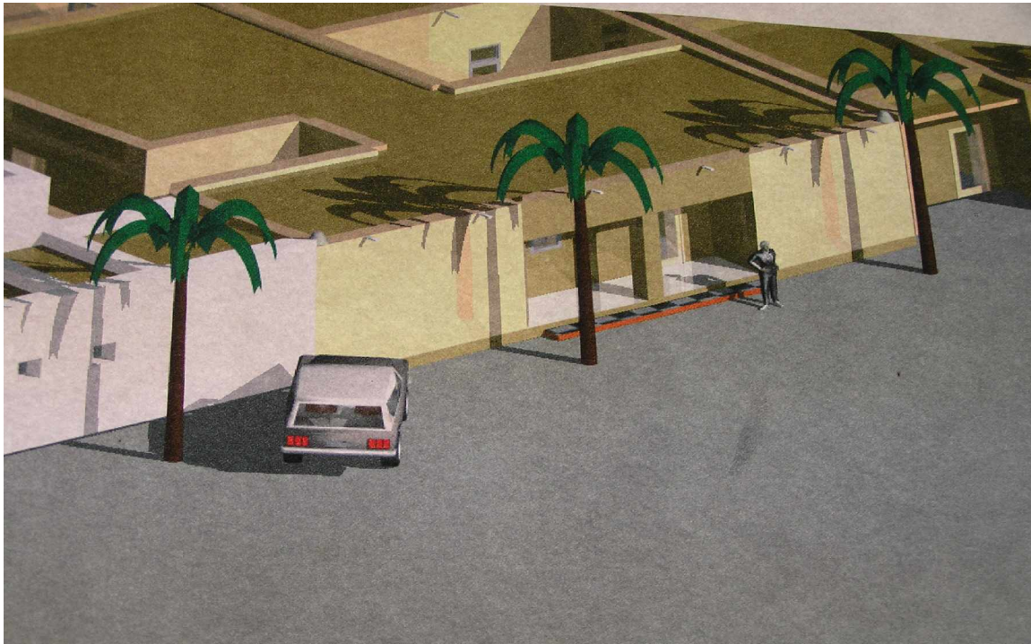
Plan de la reconstruction de Bilma

L'équipe technique a aussi conseillé sur les normes pour une reconstruction plus durable. Une brique est fabriquée à base d'une brouette d'argile, trois brouettes de sable et de l'eau. L'équipe a aussi recommandé la préparation de 100,000 briques avant le commencement des efforts de reconstruction de la ville. A présent, 70,000 briques ont été fabriquées, soit 70% de ce qui est nécessaire au lancement de la reconstruction de la commune.