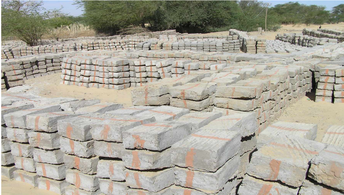
Fabrication de briques

L'Etat a mobilisé des moyens pour aider dans les efforts de reconstruction, y compris à travers l'appui d'un chargeur et de 5 camions bennes. En plus, 100 pelles, 100 pioches et 50 moules pour les briques ont été envoyés. Le chargeur doit détruire toutes les maisons de Bilma suite à la décision du Gouvernement que Bilma serait complètement reconstruite et que chaque famille aurait une maison. Il est espéré que la reconstruction complète de la commune sera finie d'ici l'hivernage prochain.